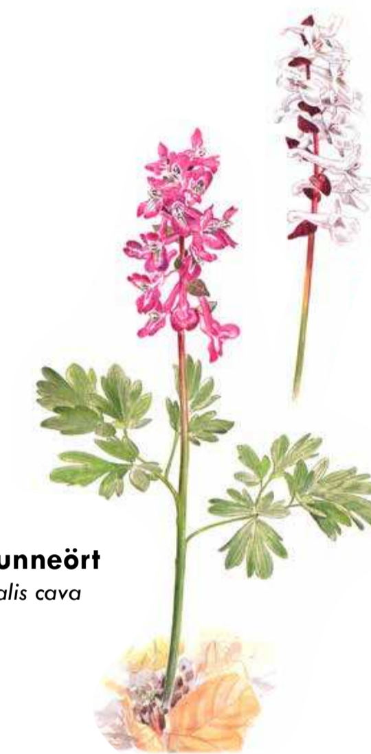
hålnunneört Corydalis cava