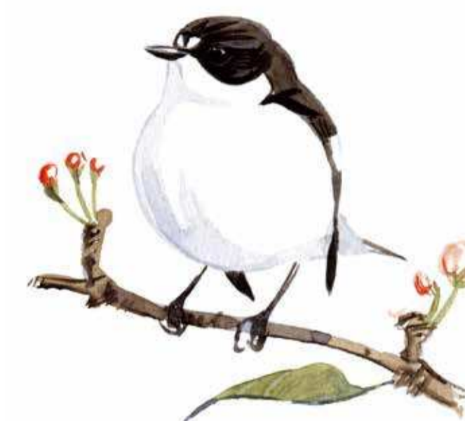
svartvit flugsnappare Ficedula hypoleuca