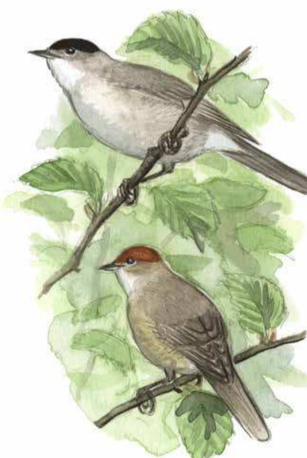
svarthätta Sylvia atricapilla

Vitskråp är sällsynt i Sverige och förekommer nästan bara i Skåne. Den växer där det är fuktigt i lövskog, raviner och vid källor och bäckar. Första fynduppgift i Sverige är just från byn Fågelsång i Skåne och publicerades år 1737.