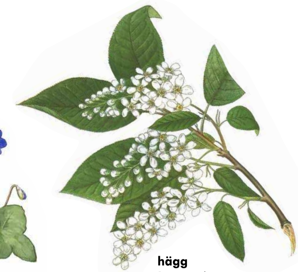
hägg Prunus padus