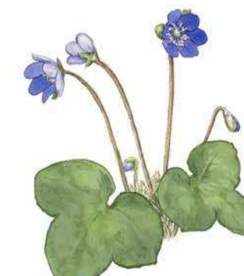
blåsippa Hepatica nobilis