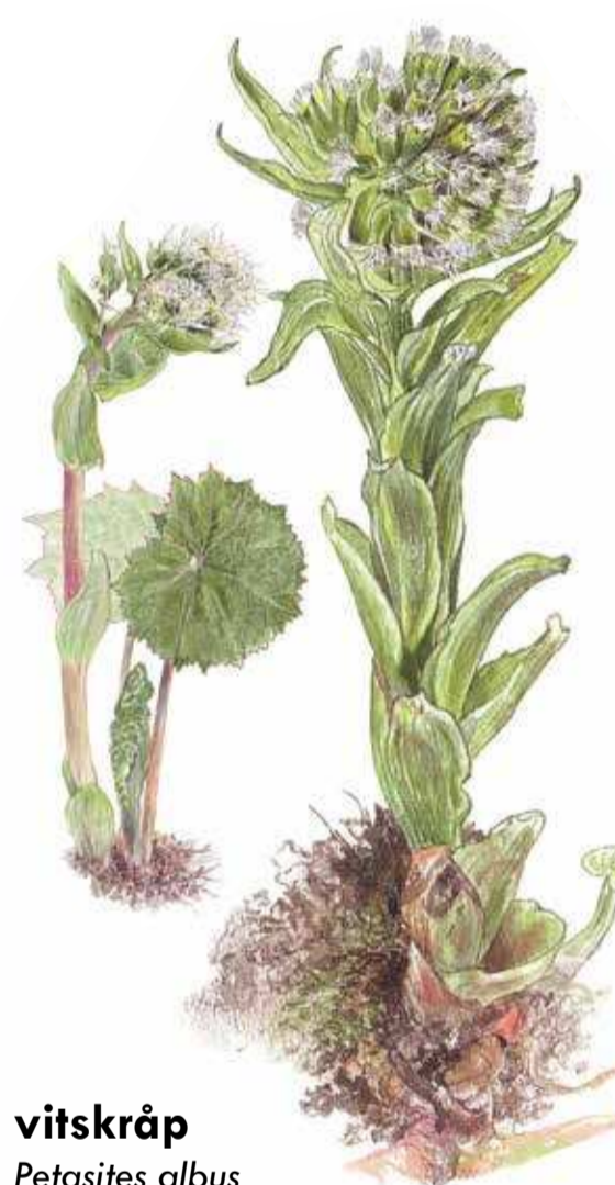
vitskråp Petasites albus

Vitskråp är sällsynt i Sverige och förekommer nästan bara i Skåne. Den växer där det är fuktigt i lövskog, raviner och vid källor och bäckar. Första fynduppgift i Sverige är just från byn Fågelsång i Skåne och publicerades år 1737.